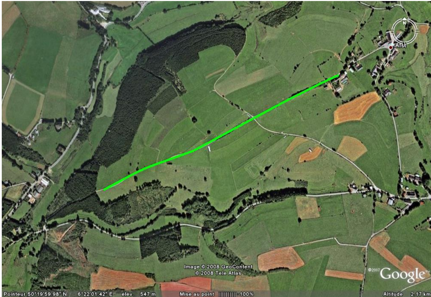
Manderfeld - Afst : Die bestehende Teerung von Manderfeld kommend durchziehen bis zur Ortschaft Afst.