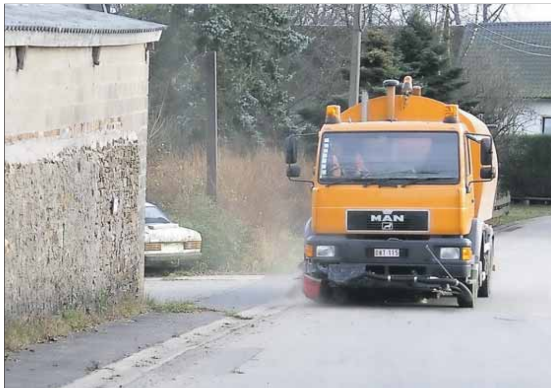
Die Kehrmaschine der Gemeinde Büllingen erwies sich als sehr reparaturanfällig und wird durch ein neues Modell ersetzt.

Zwei Vertreter aus den Reihen der Opposition lehnten es ab, dass dem Verwaltungsrat der Sporthalle Büllingen eine größere Menge Brennstoff gewährt wird, fünf Ratsmitglieder enthielten sich in dieser Frage der Stimme.