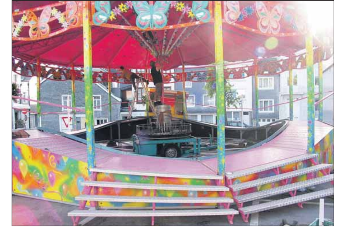
Malmedy putzt sich heraus für die diesjährige Kirmes, die heute Abend eröffnet wird.