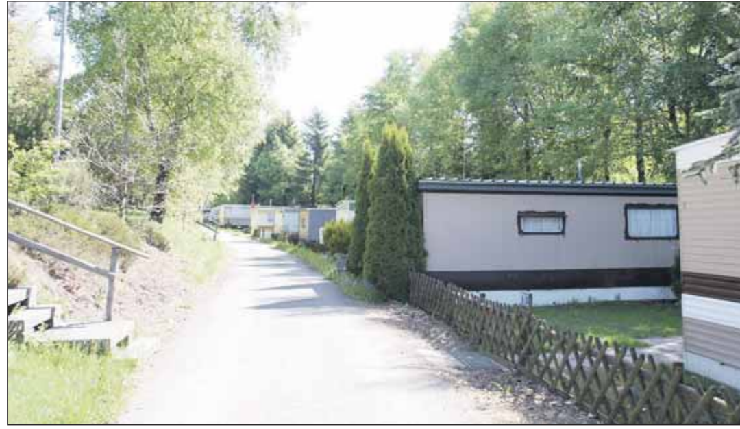
Die »Bewohner« des Campingplatzes »Edelweiß« (Foto) sind nach Angaben von Büllingens Bürgermeister Friedhelm Wirtz bereit, mit dem neuen Betreiber zusammenzuarbeiten.

Büllingen: Camping »Edelweiß« Thema im Gemeinderat