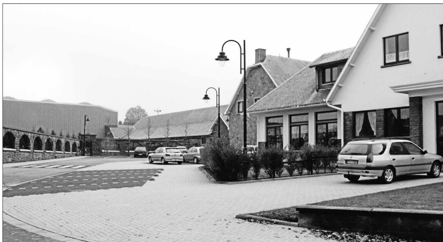
Auf dieser Aufnahme erkennt man mehrere der sieben öffentlichen Gebäude in der Ortsmitte von Rocherath-Krinkelt, die an einen Nahwärmeverbund mit zentralem Bio-Heizkraftwerk angeschlossen werden sollen: Sporthalle, Schule, früheres Gemeindehaus, Kindergarten (v.l.). Der Büllinger Gemeinderat beschloss, hierzu eine Machbarkeitsstudie erstellen zu lassen.

■ In der Sparte »Immobilien« ist erwähnenswert, dass die Gemeinde Büllingen zwei ihr gehörende Wohnhäuser in den Voeren demnächst öffentlich verkaufen wird.